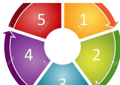
Estrategia de aprendizaje